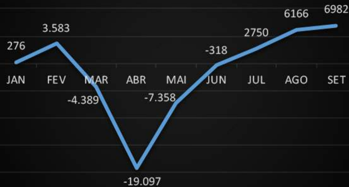
SALDO DE EMPREGOS FORMAIS ES